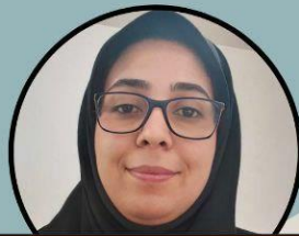
سرکار خانم گوپلی کاندید دکتری کتابداری و اطلاع رسانی پزشکی