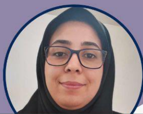
سرکار خانم گویلی کاندید دکتری کتابداری و اطلاع رسانی پزشکی